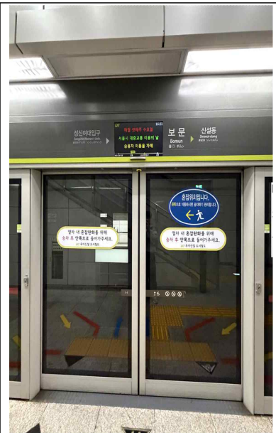
보문역 탑승구 (우이신설선)